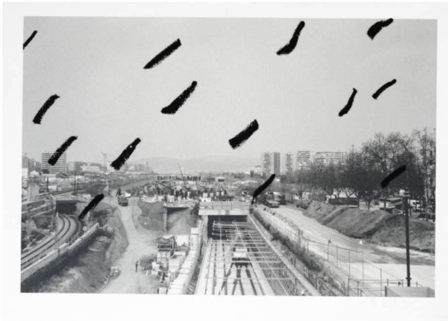
"Paisatges Químics", 2022 Tècnica mixta sobre paper 42 x 50 cm

Tono Carbajo [Vigo, 1960], la seva obra es construeix a partir del joc d'oposats i la interacció entre elements diversos, establint relacions inesperades que desafien la lògica i l'ordre convencional. La seva poètica constructiva incorpora materials aliens a la pintura, transgredint-ne els límits fins a dissoldre'ls completament, donant lloc a composicions depurades i d'una gran força expressiva.